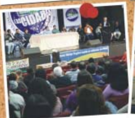
Arapongas - 29 de maio