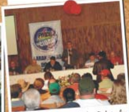
Laranjeiras do Sul - 5 de junho

As matérias de todos os encontros você vê no www.pmdbpr.org.br