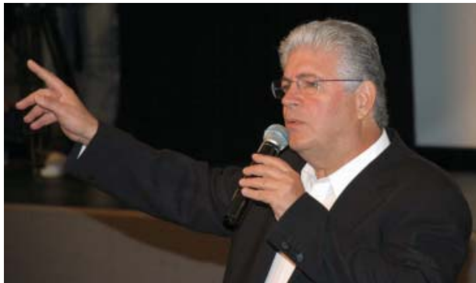
População reconhece realizações de Requião

No Paraná, o Vox Populi entrevistou 700 eleitores entre os dias 16 e 25 de maio. A margem de erro da pesquisa no Estado é de 3,7%. Em todo o País, o levantamento ouviu 6.625 pessoas.