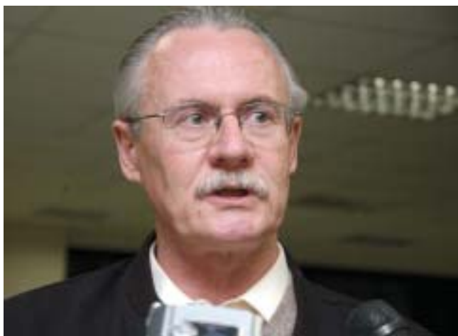
"Muitas obras já estão 100% encaminhadas"