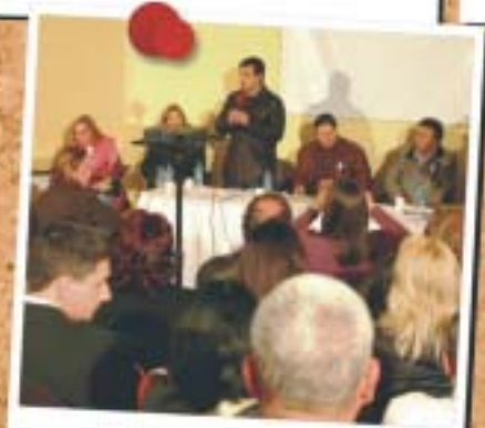
Dourados - 31 de maio