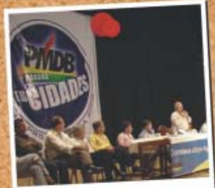
Jacarezinho - 25 de abril