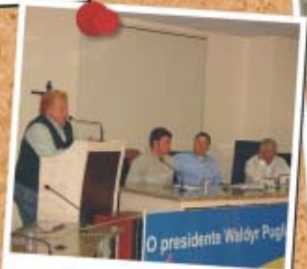
Paranaíba - 9 de maio