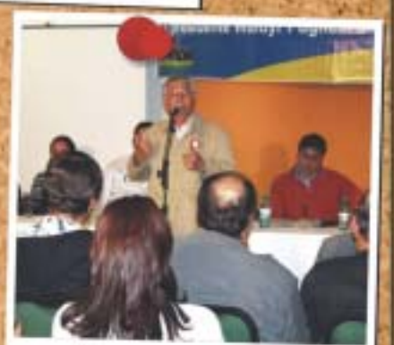
Guarapuava - 15 de maio