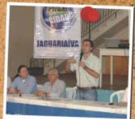
Jaguariaíva - 26 de abril