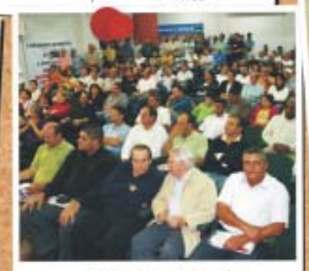
Cianorte - 5 de junho