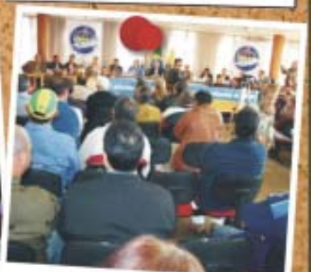
Sta. Irapina - 30 de maio