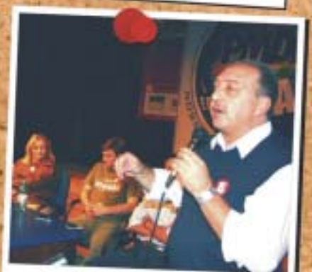
Lapa - 17 de maio