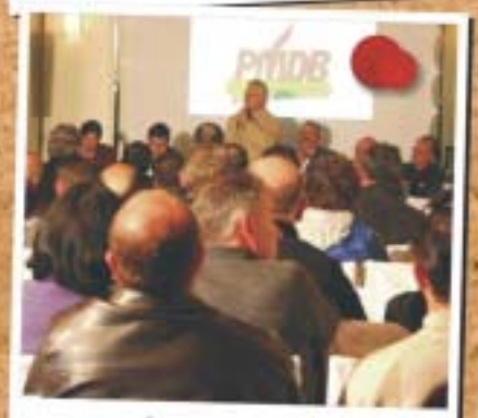
Irati - 16 de maio