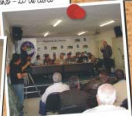
Curitiba - 10 de maio