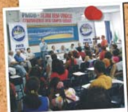
Ponta Grossa - 26 de abril